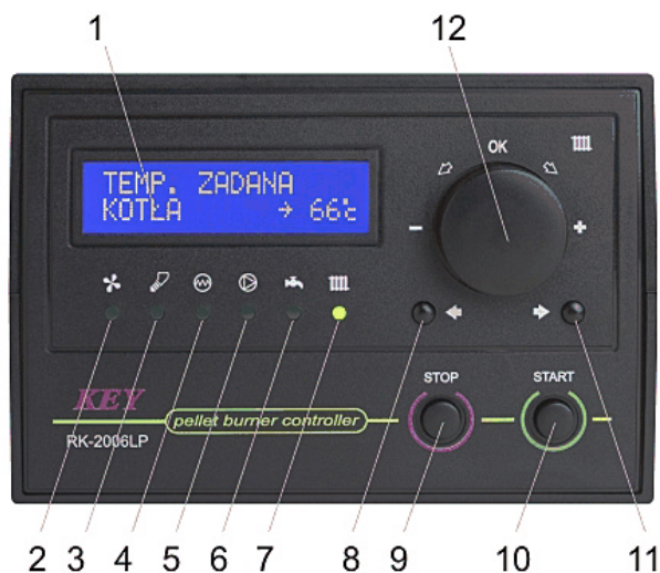
Рис. 1. Передняя панель контроллера RK-2006LP.