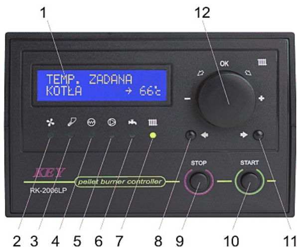
Rysunek 1. Płyta czołowa regulatora RK-2006LP.